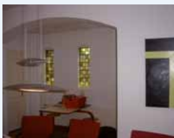
Voor de restyling.

Mijn taak was het creëren van een prettige sfeer in de twee zalen waar de aktes gepasseerd worden. Ook de welkomstruimte mocht ik aanpakken.