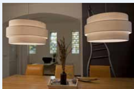
De blauwe tweede zaal.