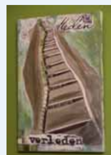
Kunst in de welkomstruimte.